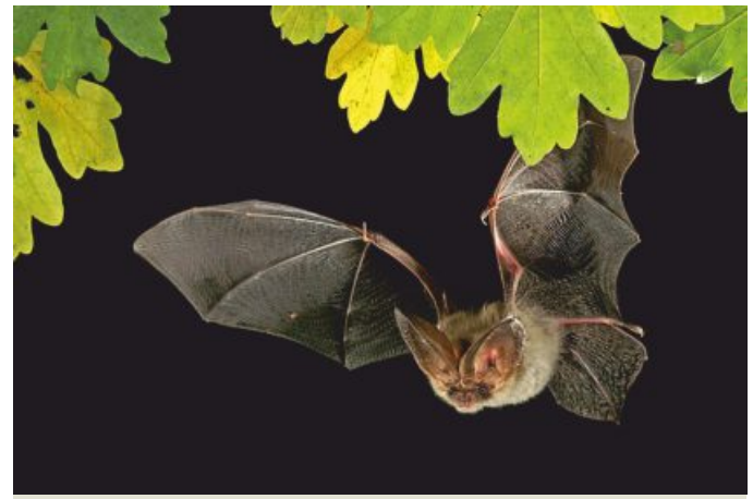
Braunes Langohr

E-Mail: ricky.stankewitz@nabu-langenhagen.de