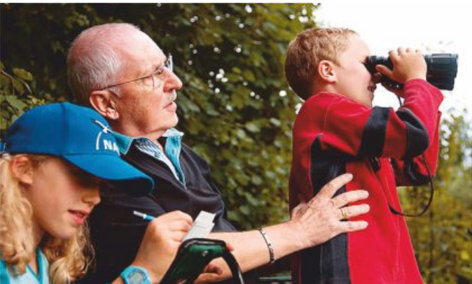
Vogelbeobachtung zur Stunde der Gartenvögel

Weitere Informationen erhalten Sie unter http://www.nabu.de/ auf der Homepage des NABU.