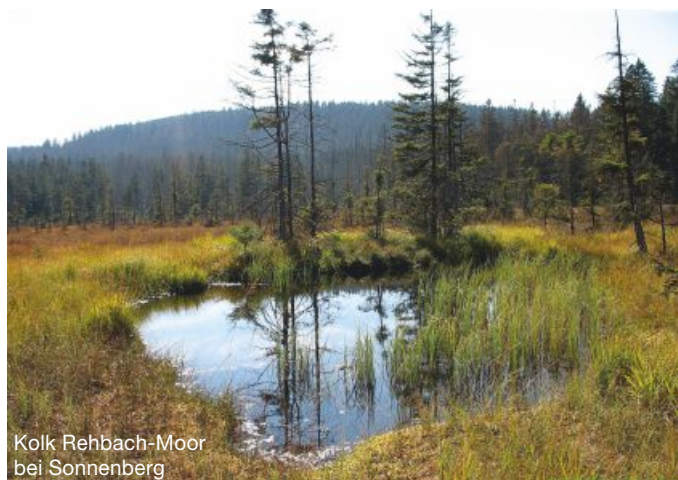
Kolk Rehbach-Moor bei Sonnenberg

E-Mail: georg.obermayr@nabu-langenhagen.de