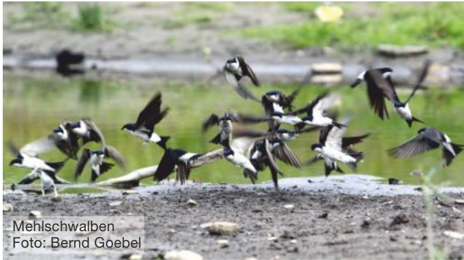
Mehlschwalben