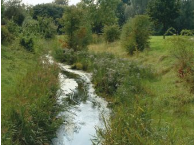
Die Fösse bei Hannover-Badenstedt