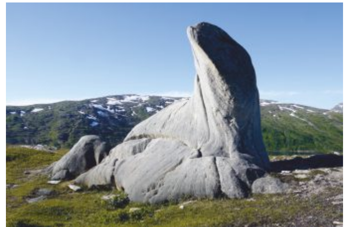
Glomfjord Seelöwe im Låhko Nationalpark