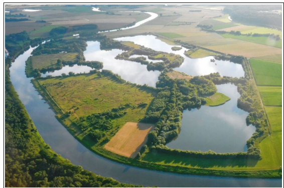
Die Liebenauer Kiesgruben bei Nienburg an der Weser

In einer Weserschleife südöstlich von Nienburg liegen die Liebenauer Kiesgruben, die im Juni Ziel einer Tagesfahrt des NABU Langenhagen sein werden. Auf lange Sicht soll in den ehemaligen Kiesgruben, die 2008 ihren Betrieb eingestellt haben, eine naturnahe Auenlandschaft entstehen. Nach und nach hat die NABU-Stiftung das Gebiet, das 2012 zum Naturschutzgebiet erklärt wurde, käuflich erworben. Geplant ist die Übernahme der gesamten Fläche bis 2017.