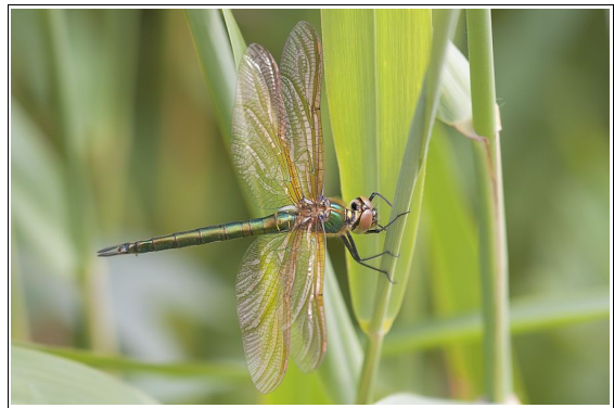
Weibliche Glänzende Smaragdlibelle

eurosibirisch verbreitete Falkenlibelle mit dem typischen Smaragdlibellen-Erscheinungsbild. Diese Libelle wird bis zu 6 cm lang und erreicht eine Flügelspannweite von 7 cm. Beide Geschlechter der Glänzenden Smaragdlibelle zeigen eine auffallende, rein grüne bis goldgrüne, metallische Färbung. Auf der Stirn befindet sich eine breite, gelbe Querbinde oberhalb des Mundes. Das