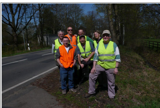
Dank der ehrenamtlichen Helfer wurden wieder viele Amphibien gerettet

Die Wandersaison unserer Amphibien war in diesem Jahr ein stetiges Auf und Ab. Immer wieder eintretende Kälteeinbrüche sorgten für wenig bis gar keinen Betrieb am Krötenzaun. Selbst in Nächten, bei denen gute Temperaturen herrschten, fehlte der Niederschlag und somit die Feuchtigkeit, so dass eine „Massenwanderung“ ausblieb. Dennoch konnten in Evershorst, bis zum Zaunabbau am 19. April, 306 Tiere (250 Männchen, 56 Weibchen) sicher über die