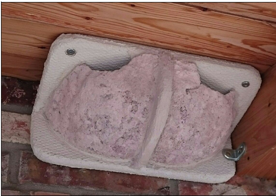
Künstliche Nisthilfe für Schwalben