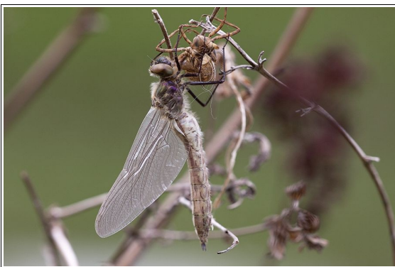
Frisch geschlüpfte Falkenlibelle