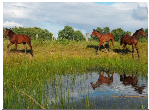
Fohlen am Kleingewässer auf der Naturweide

sehr komfortable Lösung zur Offenhaltung der Gewässer ist. Wenn man bedenkt, dass Langenhagen eine Stadt mit »Pferdestärken« ist, erschließt sich daraus ein gewaltiges Potential für den Naturschutz, wenn es gelingt, weitere Pferdehalter für vergleichbare Projekte zu gewinnen. Schon im Juni hatten wir mit der Rudi Rotbein Gruppe beim Tümpeln neben zahlreichen Tieren den Mittleren Sonnentau am Ufer gefunden. Dieser Fund beweist, dass Beweidung und Schutz von seltenen Pflanzen sich nicht grundsätzlich ausschließen. Nachdem wir Anfang September schon die Westliche Dornschrecke, eine sehr seltene und stark gefährdete Heuschreckenart auf Kreyen Wisch nachweisen konnten, gelang der Nachweis derselben Heuschreckenart auch am Tümpel auf der Naturweide.