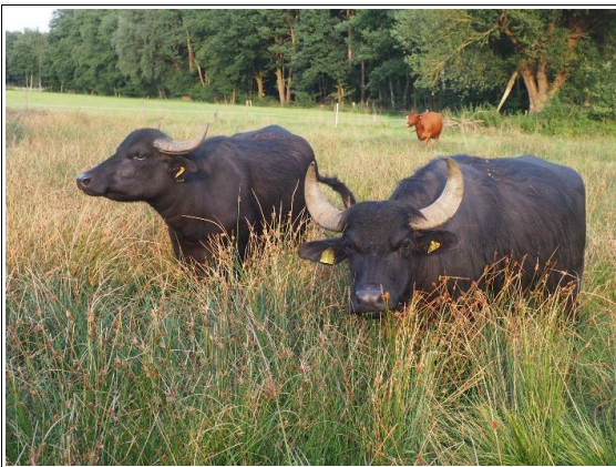
Wasserbüffel als Landschaftspfleger in Kananohe

Aktuell betreut der NABU Langenhagen im Stadtgebiet 36 Kleingewässer und zwei weitere in Heitlingen. Um sicherzustellen, dass sich diese Kleingewässer im Frühjahr durch Sonneneinstrahlung schnell erwärmen können, ist es erforderlich, regelmäßige Pflegemaßnahmen durchzuführen. Ein Großteil der Tümpel wird von ehrenamtlichen Helfern in Handarbeit gepflegt, wobei die umliegenden Grünlandflächen von den jeweiligen Flächen-eigentümern an Landwirte verpachtet sind und von diesen gemäht werden. An elf Kleingewässern kommen