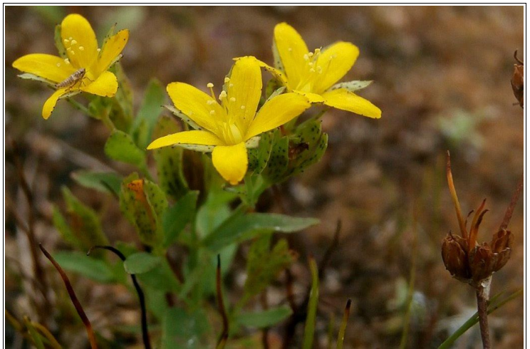
Abbildung 9: Das Niederliegende Johanniskraut ( Hypericum humifusum ) gehörte zu den besonderen Funden bei der Arteninventur.

Trotz der Feststellung, dass eine vollständige Artenerfassung innerhalb der gegebenen Zeit schlichtweg nicht möglich sei, hatten alle Beteiligten Spaß an der Zählung und konnten einen Erfolg von unglaublichen 205 Arten verbuchen. Den größten Anteil davon stellten mit 87 Arten die Pflanzen, gefolgt von über ein eigens beauftragtes Vogelgutachten gezählten 62 Vogelarten und 48 Insektenarten. Außerdem konnten mit Erdkröte, Teichfrosch und Teichmolch drei Amphibienarten, sowie mit der Ringelnatter auch eine Reptilienart nachgewiesen