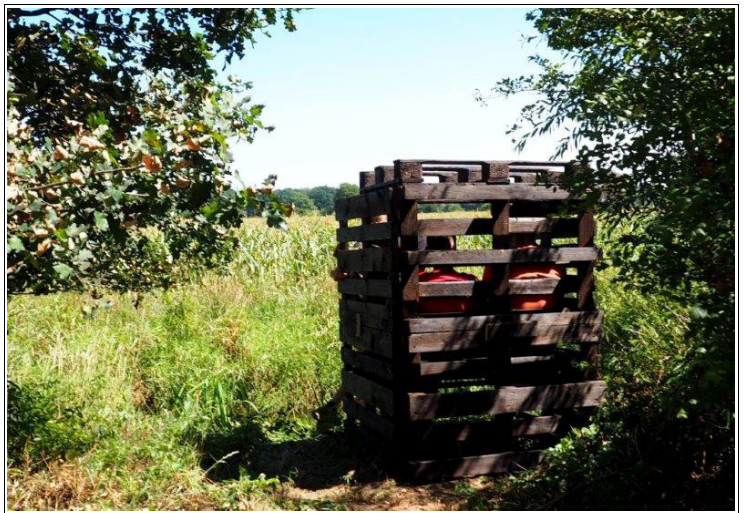
Abbildung 6: Der Strandkorb „Wietzeblick“ am Wietzeufer auf der Naturinsel ist eines der Upcycling-Projekte der NAJU

Als Teil ihrer „Upcycling-Projekte“ aus Paletten ergänzte die NAJU ihre Ausstattung mit einem Selfmade-Strandkorb, welcher seinen Platz direkt am Ufer der Wietze fand. Dieser Beobachtungspunkt