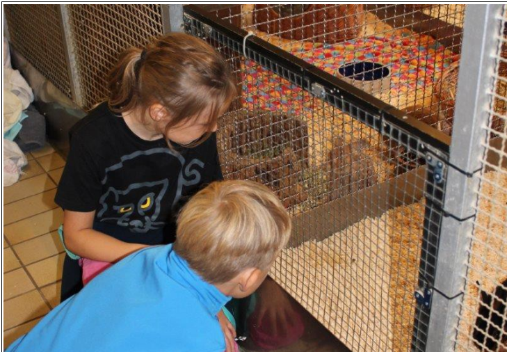
Abbildung 3: Im Tierheim waren die Kinder besonders von den Kleintieren fasziniert.

eine große Hornisse vorbeisauste! Nach zwei Stunden waren alle ordentlich durchgepuset und das Betreuersteam sammelte wiederum die Kinder ein.