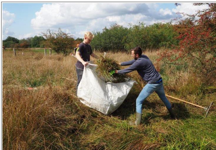
Abbildung 12: Bei den Pflegeeinsätzen des NABU Langenhagen sind die Jugendlichen aus der NAJU eine tragende Stütze.

...kommt man um eine manuelle Pflege von Kleingewässern nicht herum. Durch natürliche Sukzessionsprozesse verlanden flache Kleingewässer innerhalb eines Jahrzehnts und sind dann für Amphibien ungeeignet. Um diesen Prozessen entgegenzuwirken hat der NABU Langenhagen Pacht- und Pflegeverträge mit Behörden und Partnern aus der lokalen Wirtschaft, wie der Flughafen Hannover Langenhagen GmbH abgeschlossen. Dort, wo eine Beweidung noch nicht etabliert werden konnte, werden verschiedene Pflegeeinsätze durch-