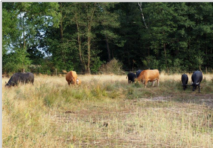
Abbildung 11: In Kananohe sind sowohl Hausrinder als auch Wasserbüffel zur Pflege der wertvollen Naturschutzflächen im Einsatz.

– würden Hochwasserereignisse regelmäßig neue Gewässer schaffen oder größere Pflanzenfresser die Gewässer als Tränken offenhalten. Bevor es automatische Viehtränken gab, waren auf Viehweiden Tümpel unabdingbar, um die Tiere mit Wasser zu versorgen. Heute sind Weidetümpel weitestgehend verschwunden. Bereits seit dem Jahr 2008 steuert der NABU Langenhagen mit verschiedenen Konzepten gegen den Verlust dieser wertvollen Lebensräume an.