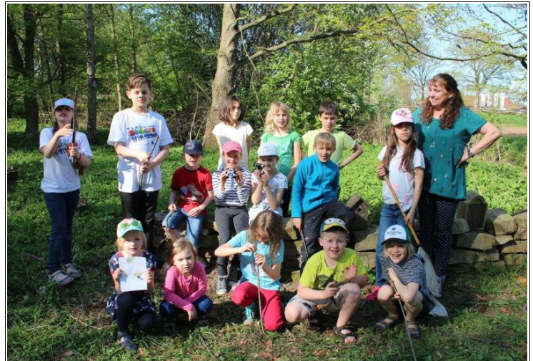
Abbildung 2: Auf der Naturinsel konnten die Kinder eine Menge entdecken.

Im April wurde der Frühling auf der Naturinsel entdeckt. Ob Erlenblattkäfer oder Rollassel, ob Spinnenmännchen oder mit Pollen bepackte Wildbiene, alle Kleintiere wurden genau unter die „Becherlupe“ genommen. Größere Tiere, wie Eichhörnchen, Meisen oder Bussard konnten mit Hilfe von Ferngläsern betrachtet werden. Von der Nachtigall war allerdings nur der Gesang aus dem dichten Haselnussdickicht zu hören.