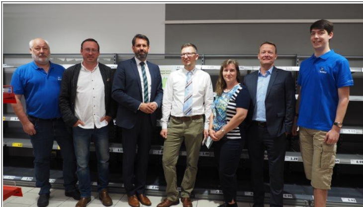
Abbildung 5: Zusammen mit dem Niedersächsischen Umweltminister Olaf Lies, Vertretern der REWE Group und vom NABU Bundesverband machte die NAJU auf die Folgen des Bienensterbens aufmerksam.