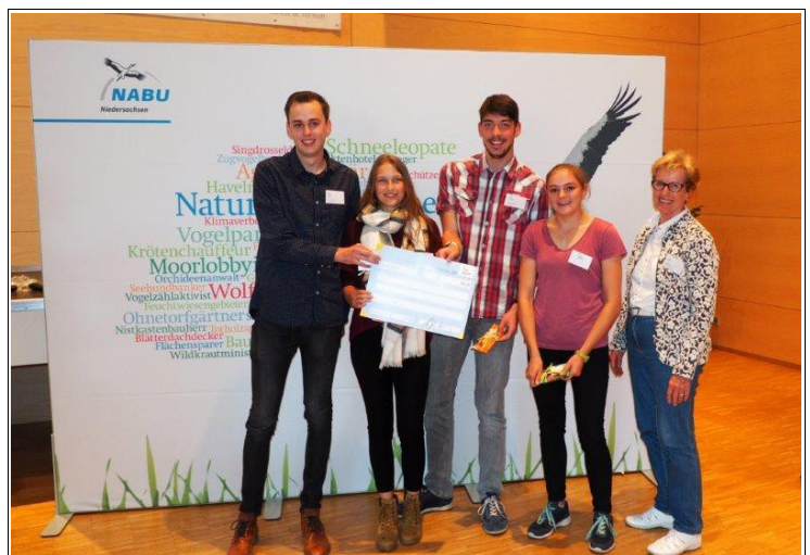
Abbildung 4: Glückliche Gewinner, beim Dr. Fedor Strahl Jugend Naturschutzpreis belegte die NAJU Langenhagen den 2. Platz.

So wie die „Kleinen“ klein anfangen, starteten die Großen in der NAJU dieses Jahr mit ihrer spontanen Teilnahme am Wettbewerb zum Jugendnaturschutzpreis 2018 richtig durch. Dessen Verleihung fand am 16. September 2018 auf der Landesvertreterversammlung des NABU Niedersachsen statt. Die vier Mitglieder des Vorstandes der NAJU Langenhagen reisten zu diesem Anlass extra an, um den Preis im würdigen Rahmen entgegenzunehmen.