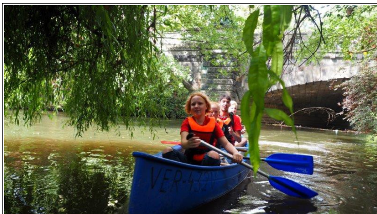
Abbildung 13: Viel Spaß hatten die Aktiven der NAJU Langenhagen bei der Kanu Tour auf der Ihme und Leine.

Die NAJU Langenhagen wagte sich am 08. September 2018 aufs Wasser. Mit dieser gemeinschaftlichen Aktion möchte sich die NAJU Langenhagen bei ihren Teilnehmern für Engagement im Naturschutz bedanken und mehr Zeit in ihrem eingespielten Team verbringen.